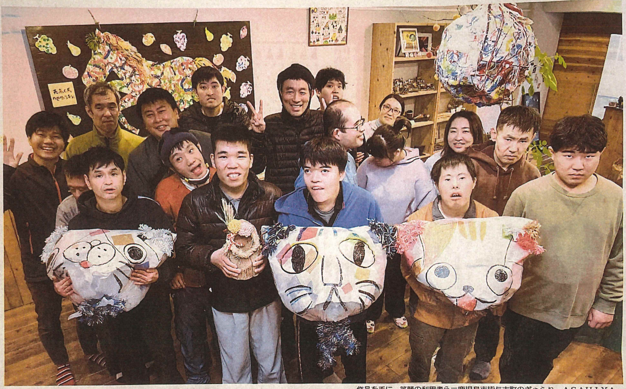
作品を手に、笑顔の利用者ら＝鹿児島市皆与志町のぎゅらりーASAHIYA

木のぬくもりがあふれるギャラリーに入ると、色鮮やかなアート作品が目飛び込んできた。鹿児島市皆与志町の障害者支援施設「あさひが丘」に併設されている「ぎゅらりーASAHIYA」。知的障害や自閉症のある18〜70歳の約100人が制作した陶芸、絵画、革製品など世界に一つない独創的な作品が広がる。