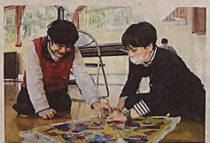
制作風景の動画はこちらから