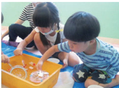
夏祭りごっこ～金魚すくい～

など、いい効果が生まれています。また、保護者からの相談においても、落ち着いた空間でゆっくりと話ができたり、職員の視点からは、衛生面の確保や業務上動きやすい動線を確保することができたと好評です。ハード面がより充実したことをきっかけに療育の質の向上を図り、地域の幼稚園や保育園のバックアップ体制をはじめ、成長していく子どもたちが、社会に適応していくための支援もより充実させていきたいと思っています。鹿児島市の中心である天文館地域の拠点として機能していけるよう努めてまいります。