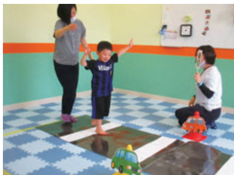
認知課題遊び～横断歩道をわたろう!!～