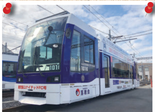
市電ユナイテッド号に落穂会の広告掲載