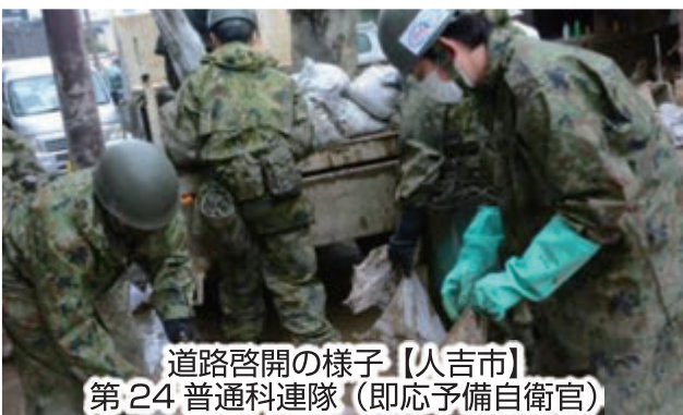
道路啓開の様子【人吉市】 第24普通科連隊(即応予備自衛官)