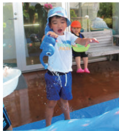
マルヤガーデンズ“ソラニワ”での水遊び