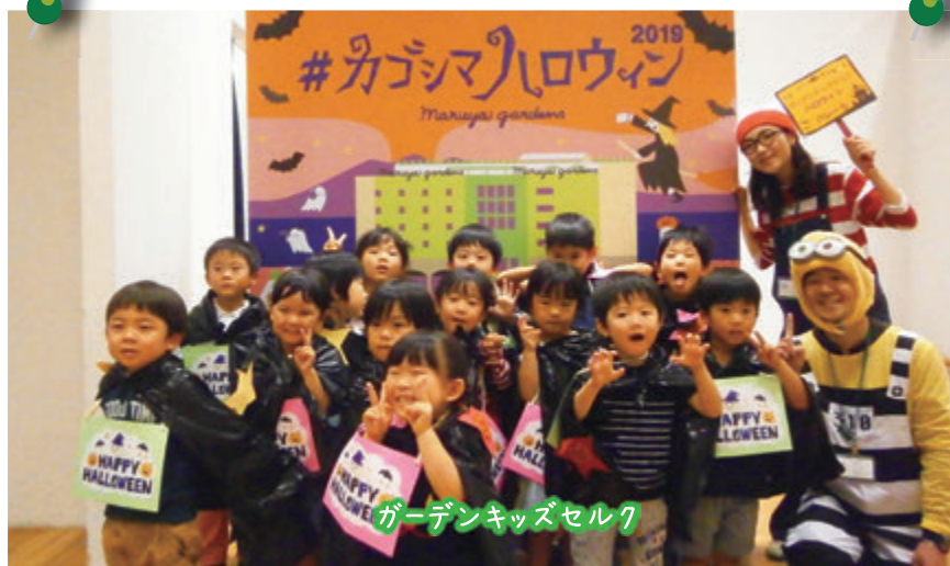
ガーデンキッズセルク