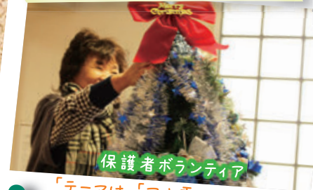
保護者ボランティア