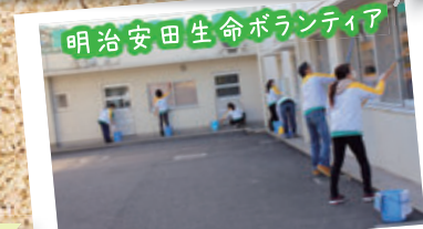
明治安田生命ボランティア