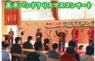
高木バンドクリスマスコンサート