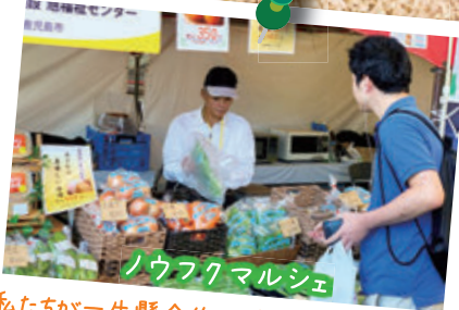
ノウフクマルシェ