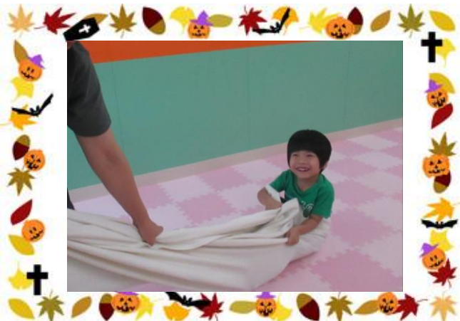
ルール遊び(シーツバス)