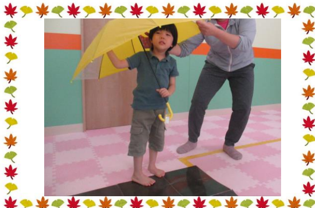
認知課題遊び(傘の使い方)

新年度が始まってから、早半年が過ぎ、あっという間に10月がやってきました。子どもたちの半年前と今とを比べると、できることが増え、大きく成長していることが感じられます。子どもたちによっては、あと半年で就学等を迎えられる方もいらっしゃると思いますが、引き続き、私たち職員一同、丁寧・誠実なサポートを心掛けて、日々支援を行い、お子さまが安心して過ごせるよう努めてまいります。