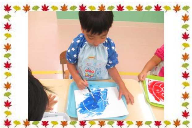
絵画遊び(はじき絵)