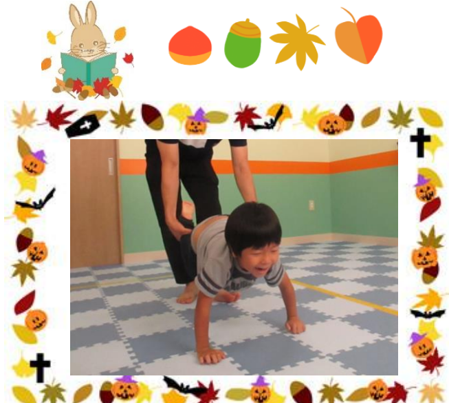
運動遊び(ライオンごっこ)