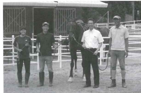
乗馬倶楽部シュバルのスタッフと水流理事長（右から 2人目）

ホースセラピー（乗馬療法）の場として2015（平 成27）年10月にプレオープンした「あさひが丘乗馬 倶楽部」に、本年4月より放課後等デイサービス事業 所として、さらに6月より法人内のすべての事業所利 用者のホースセラピーの場として開設された。ミニ チュアホースからポニー、サラブレッドまで10頭ほ どの馬を飼育している。プロフェッショナルのインス トラクターを法人職員として雇用しており、これまた 法人の本気度を大いに感じる事ができた。ホースセ ラピーは単なる動物との触れ合いにとどまらず、乗馬