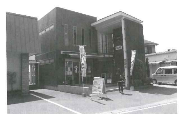
1階はベーカリーショップ、2階はカフェ

落穂会の事業展開は、個々のニーズにいていねいに 伝えるだけではなく、地域社会の状況を捉え、法制度を 活かしながら多角的になされているものだった。しか し、この表現だけでは落穂会の実践を本質的に語って いることにはならない。どの事業所、どの暮らしの場 を訪ねても漂っているのは穏やかな空気感だった。と げとげしたり緊張感が漂うような雰囲気は感じられ ず、信頼関係に基づく安心感のようなものを感じた。 同時に、昼食をごちそうになった就労継続支援B型 事業所の「カフェ NODOKA」は鹿児島市の某ネッ ト飲食店ランキングで上位にランキングされるなど “上質なもの”を追求する姿勢は随所に感じられるも のだった。