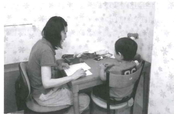
臨床発達心理士による発達検査の様子

は、店舗の従業員のための認可外保育所の運営を委託 されたことがきっかけとなり、その後の流れの中で現 在の事業へと移行していったようだ。一般の買い物客 が行き来する店内と隣接する駐車場ビルの渡り廊下沿 いにあり、おおよそ福祉事業所とは思えない佇まい で、何か習い事の教室のようにも感じられた。それは 別のビルの2階にあるガーデンキッズトリアも同様 で、いずれも若い元気あふれる保育士さんらが子ども たちと楽しそうに活動していた。わが子に障がいがあ るかも、あるいはそれがわかって先への不安が募 る、と不安を抱くこの時期に、視覚も含め、感覚的に も利用するハードルは低くしつつ、活動そのものは子 どもたちやそのご家族のニーズにしっかり応えていく 専門性を有している。都市型児童福祉事業所の今後の 姿なのかもしれないと大いに感心させられた。