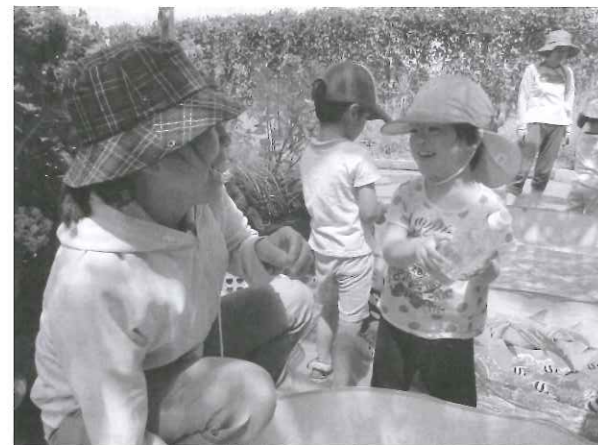
ガーデンキッズセルクのソラニワ（屋上）で

児童発達支援事業と放課後等デイサービス事業を行 うガーデンキッズセルクと同トリアは、本体施設など がある鹿児島市郊外とは違って変わり、鹿児島市の繁 華街の中心地にある。かつて百貨店として営業し、今 は複合型商業ビルの3階にあるガーデンキッズセルク