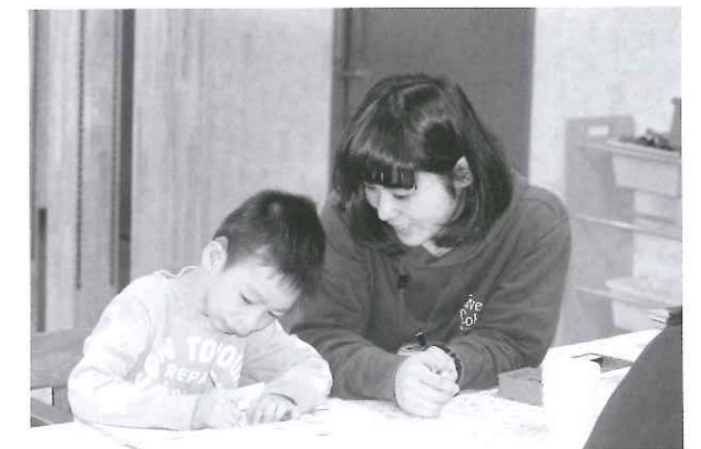
ユニットケアにより子どもたちとの個別の関わりが増えました

訪ねた日は土曜日で、行事で外出している子どもも多く、限られた子どもたちの様子しか感じられなかったが、聞くところによると、やはり以前の建物にいた時とは比べものにならないほど落ちついた様子が