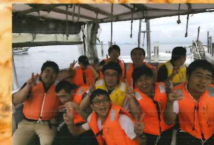
イルカウォッチング 水もしたたる いい男になっちゃう？