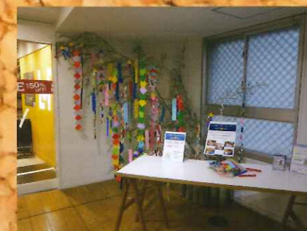
みんなで作りました!