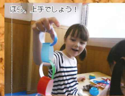
ほら、上手でしょう!