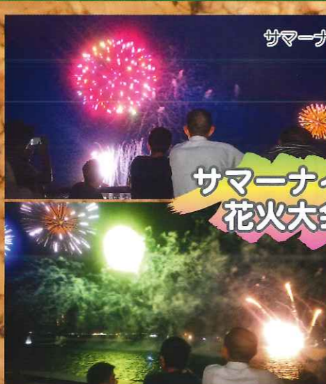
サマーナイトた〜ま〜や〜