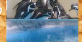
志布志に行ってきました。