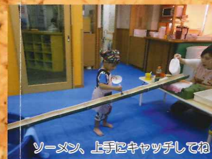
ソーメン、上手にキャッチしてね