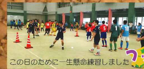
この日のために一生懸命練習しました