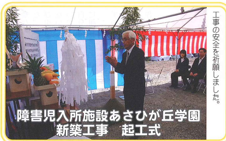
障害児入所施設あさひが丘学園 新築工事 起工式