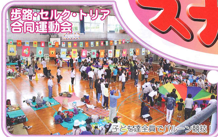
歩路・セルク・トリア 合同運動会