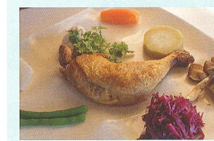
若鶏のコンフィ (1200円)

大好評ランチプレート！冬の時期のメイン料理は若鶏のコンフィです。コンフィとはヨーロッパの伝統的な調理方のひとつで、低温の脂でお肉をゆっくりと煮詰めました。皮はパリパリ！中はジューシー！！！！ぜひカフェのどかへお越しください。