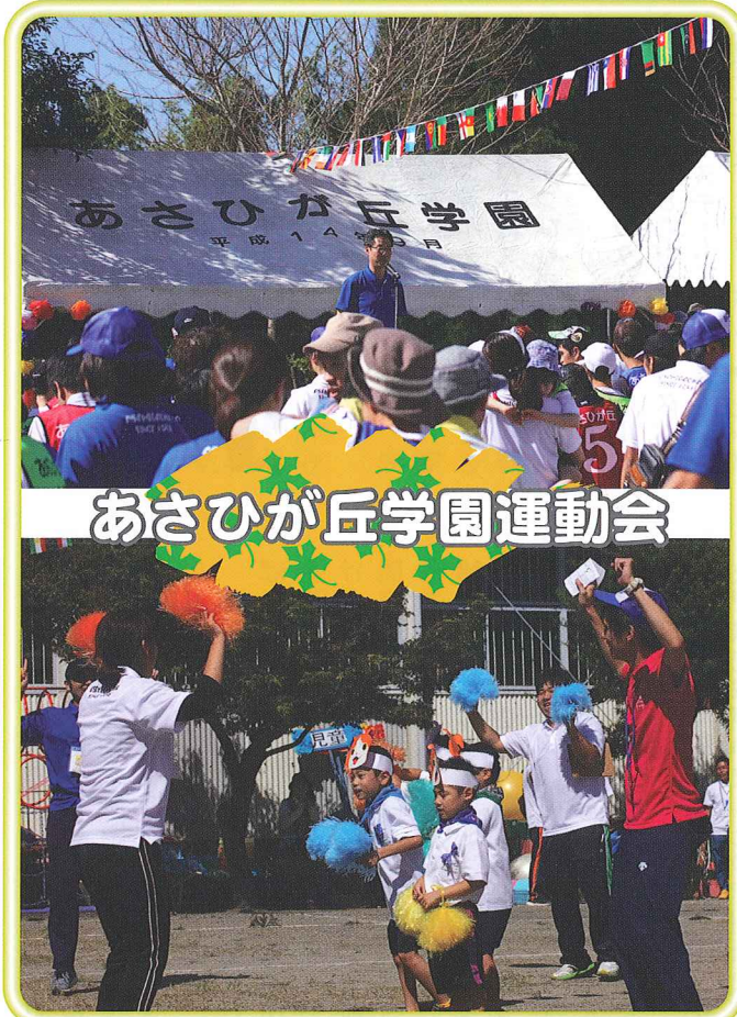
あさひが丘学園運動会