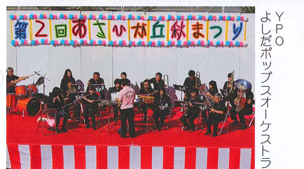
Y.P.O. よしだポップスオーケストラ

独自に磨き上げた感性と技で、私達をジャグリングの世界に引き込んでくれました。特に、九州で彼にしか出来ないという大技(沢山の箱を遠心力を使って一つずつ両手で挟むようにキャッチする)を披露してくれた際は、来場者は息を呑み、一挙手一投足を見守りました。最後の一つを見事キャッチすると、会場はひときわ大きな歓声に包まれ歓声と拍手が乱舞しました。その後は、昨年に引き続き地元の