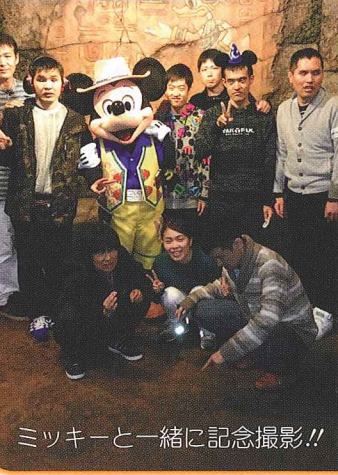
ミッキーと一緒に記念撮影!!