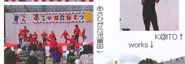
あさひが丘児童部