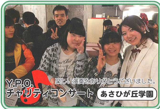
Y.P.O. チャリティコンサート 楽しい演奏をありがとうございました。 あさひが丘学園