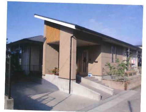
▲ 13カ所あるグループホームのうちの1つ「花梨」