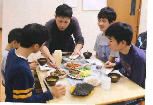
▲ (写真上) 土曜の夜はご飯づくりに挑戦 (写真下) 今夜のメニューは手巻きずし