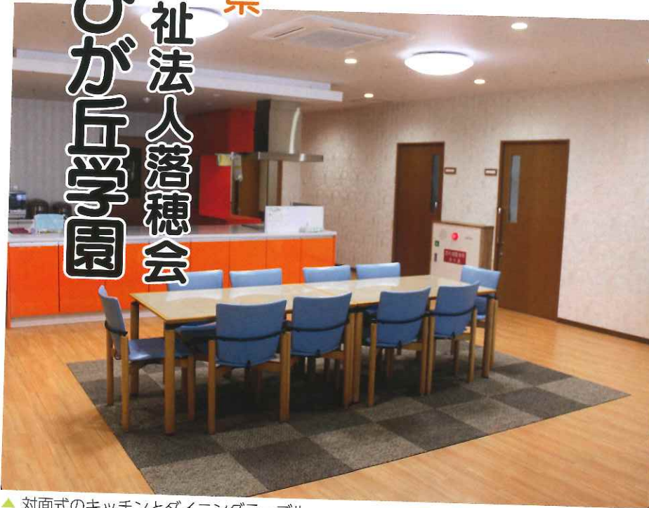
▲ 対面式のキッチンとダイニングテーブル。 食卓を囲んでの賑やかな声が聞こえてきそうです。