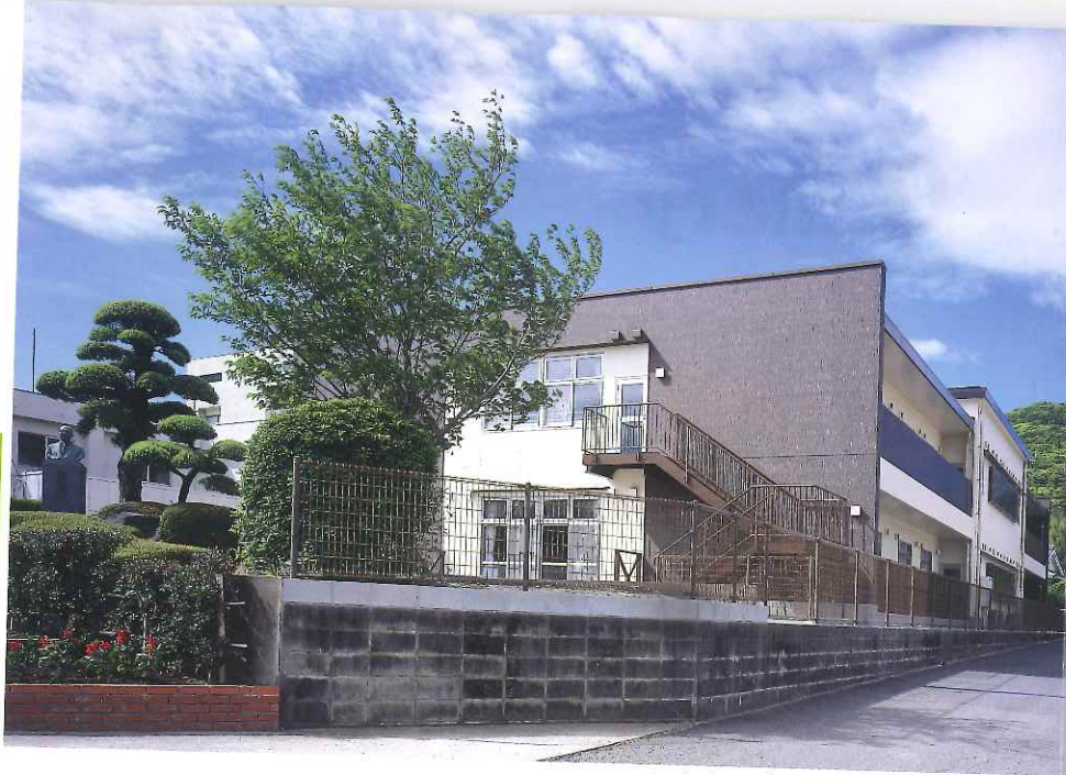
▲ あさひが丘学園新園舎外観